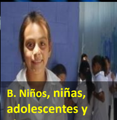
B. Niños, niñas, adolescentes y jóvenes