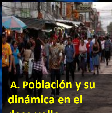
A. Población y su dinámica en el desarrollo sostenible