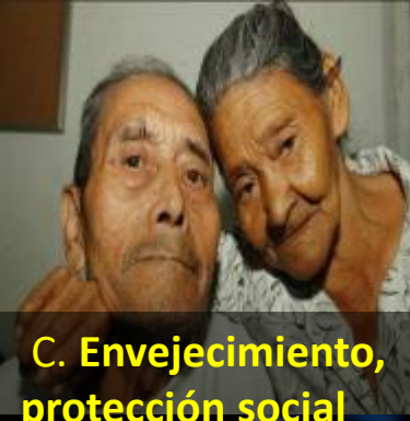
C. Envejecimiento, protección social