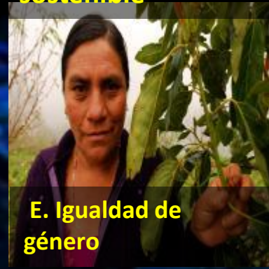
E. Igualdad de género