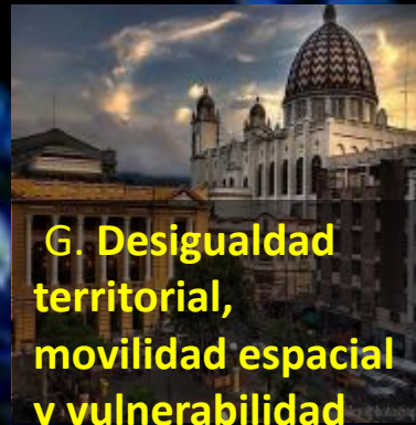
G. Desigualdad territorial, movilidad espacial y vulnerabilidad