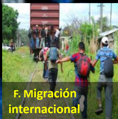
F. Migración internacional