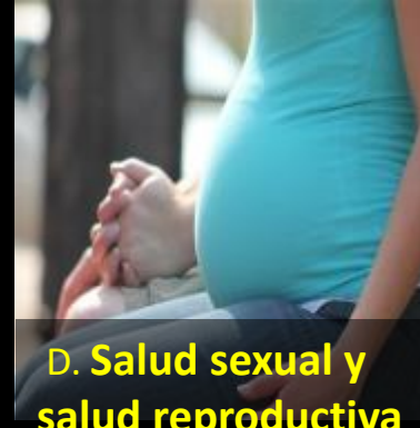
D. Salud sexual y salud reproductiva