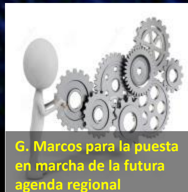
G. Marcos para la puesta en marcha de la futura agenda regional