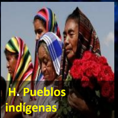
H. Pueblos indígenas