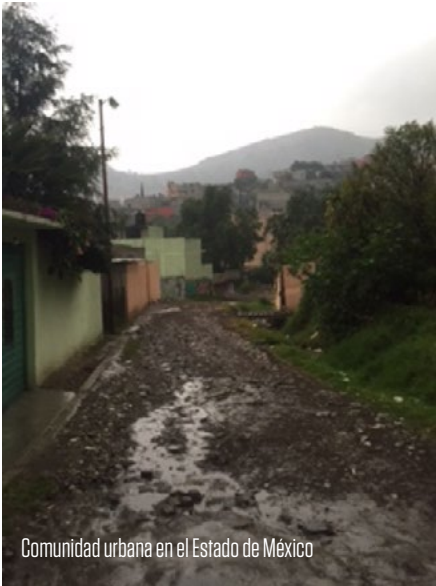
Comunidad urbana en el Estado de México