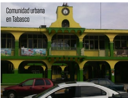
Comunidad urbana en Tabasco