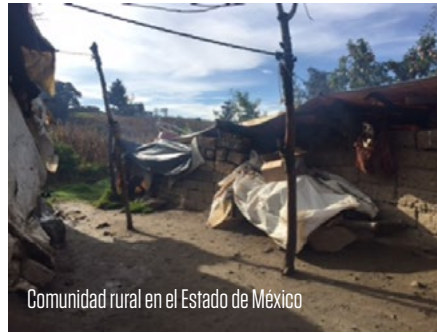
Comunidad rural en el Estado de México