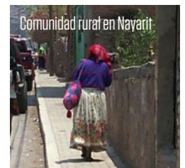
Comunidad rural en Nayarit