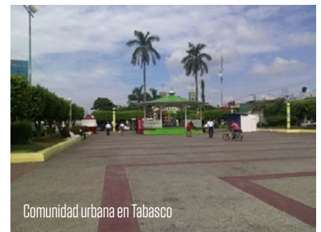
Comunidad urbana en Tabasco