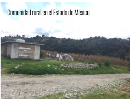
Comunidad rural en el Estado de México