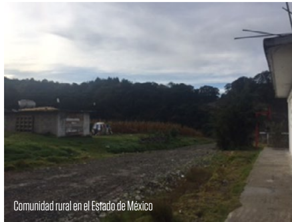
Comunidad rural en el Estado de México