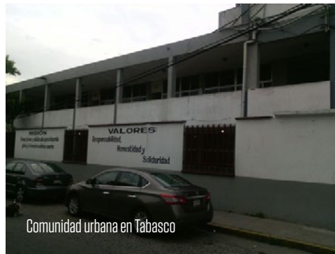
Comunidad urbana en Tabasco