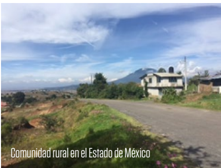
Comunidad rural en el Estado de México