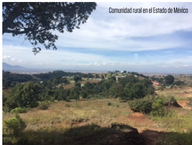
Comunidad rural en el Estado de México