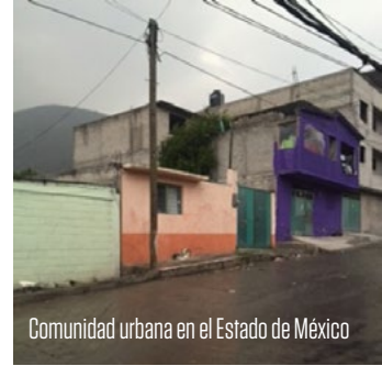
Comunidad urbana en el Estado de México